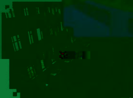
商贸管理类专业 综合训练场所