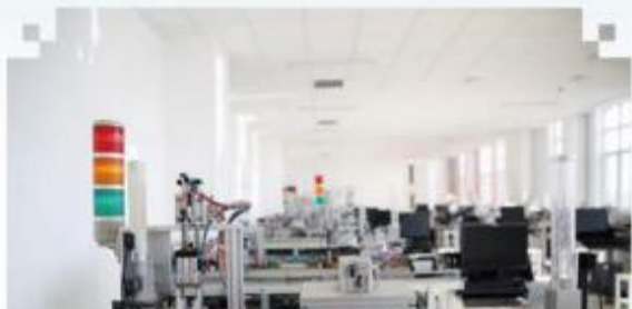
自动化生产线安装与 调试训练场所